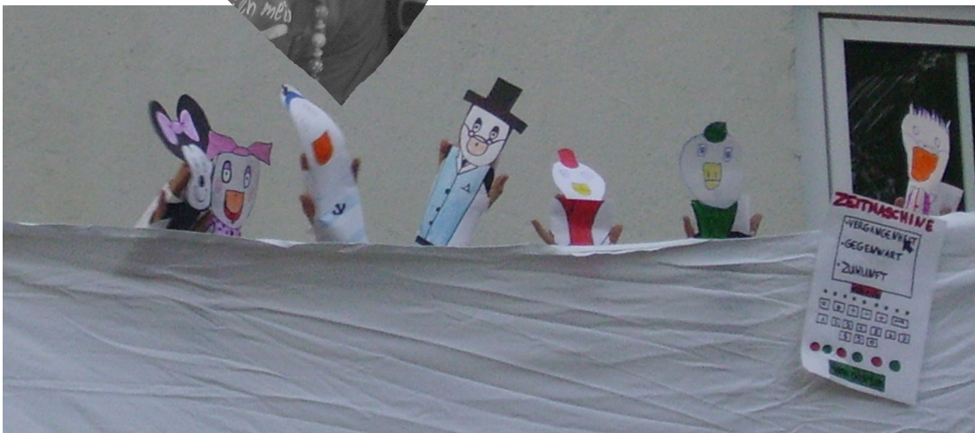
Die Bewohner Entenhausens bei einer Darbietung zum Bunten Abend