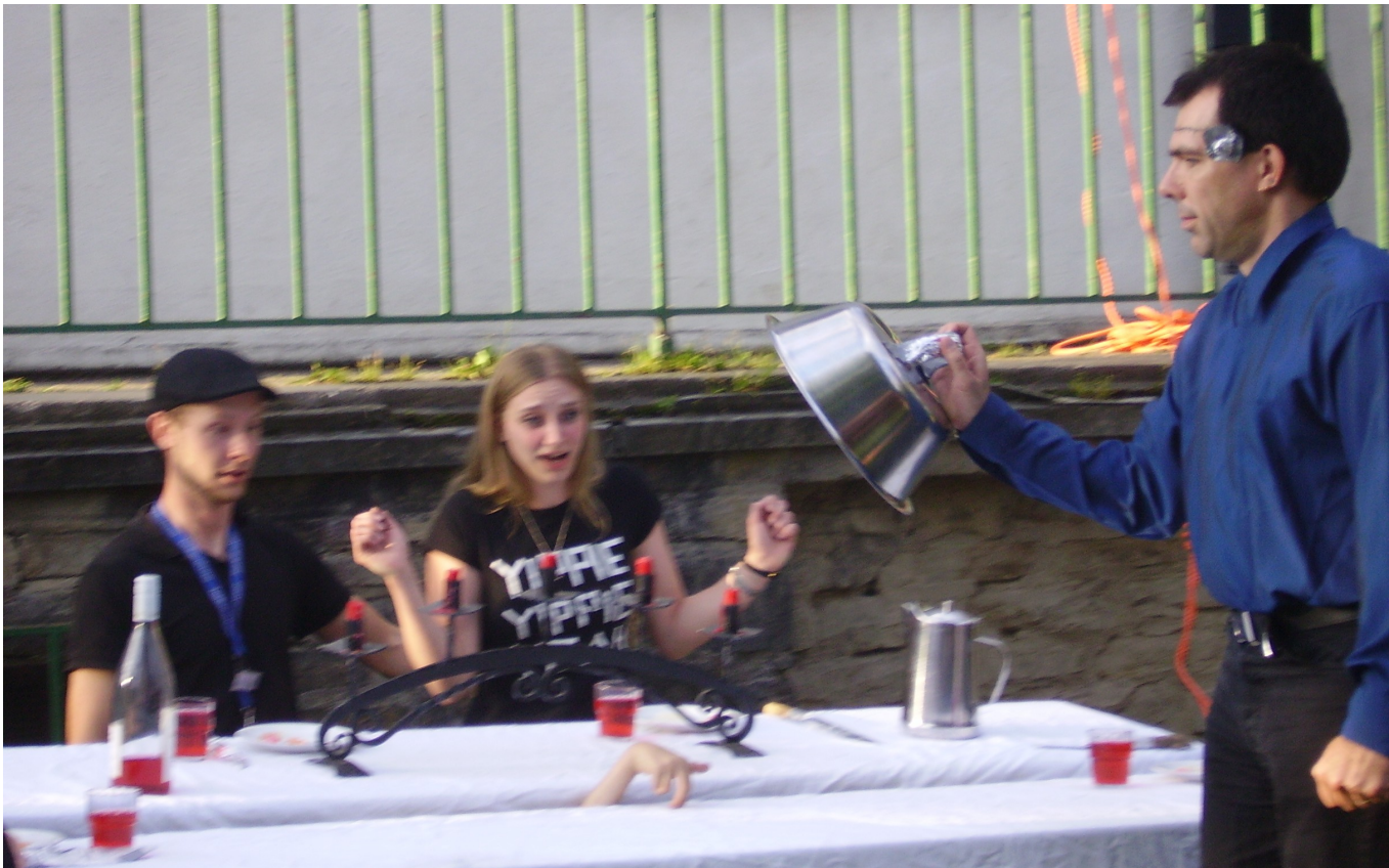
Die „Familie Addams“, der Sieger der Rallye und des Bunten Abends beim Dinner